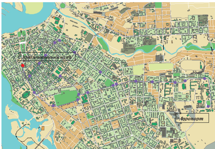
Схема проезда от Аэропорта до ИГУ (корпус №3, ул. Ленина, 3) Остановка транспорта «Художественный музей» Маршрутные такси / автобусы: 3, 20, 80, 480, 42, 43; троллейбус: 4